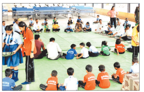
प्रवेशोत्सव में शामिल बच्चे व शिक्षक।