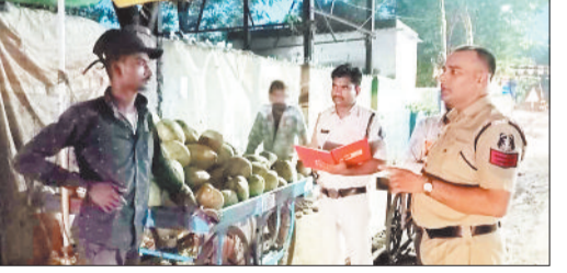
जांच करते पुलिस कर्मचारी।