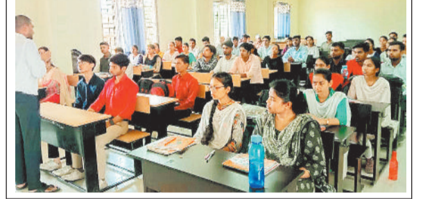
प्रवेशोत्सव में शामिल बच्चे व शिक्षक।