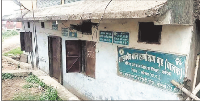
बाल संप्रेशण गृह जहां से बच्चे हुए भी फरार।

रिस्दी में महिला बाल विकास विभाग द्वारा संचालित बाल संप्रेशण गृह से बुधवार की सुबह 2 बजे अपचारी बालक संप्रेशण गृह का मेन गेट खुला देख ड्यूटी में तैनात नगर सैनिक को चकमा देकर फरार हो गए हैं, जिससे विभाग में हड़कंप मच गया है। दोनों अपचारी बालक पड़ोसी जिले जांजगीर चांपा के निवासी बताए गए हैं। घटना की सूचना विभाग द्वारा पुलिस को दी गई है।