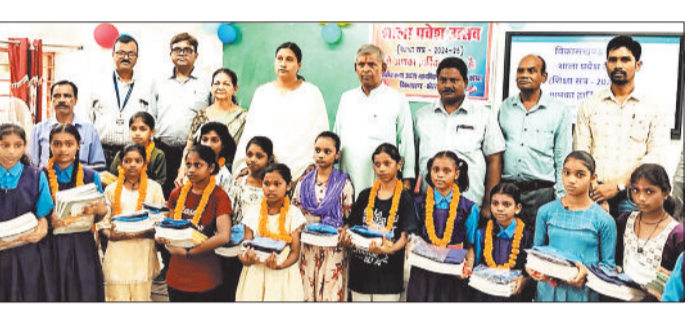
कार्यक्रम में उपस्थित अतिथि व स्कूली बच्चे।

हरिभूमि न्यूज़ ►► कोरबा ग्रीष्मकालीन के लंबे अवकाश के बाद बुधवार को अंचल के स्कूलों के दरवाजे खुलने के साथ ही बच्चों की चहल पहल बढ़ गई। शहर से गांव तक के स्कूलों में